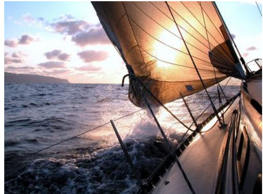
Abbildung 1: Segel im Wind

Wochenende für Mädchen von 10 bis 14 Jahren